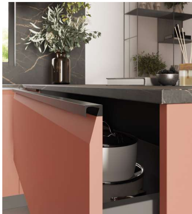
Tirador SUA + Puerta en LACA

El tirador SUA para puertas en maderas, lacadas y 3 laminados exclusivos está especialmente diseñado para añadir calidad a espacios funcionales que se adaptan al estilo de vida de los hogares contemporáneos.