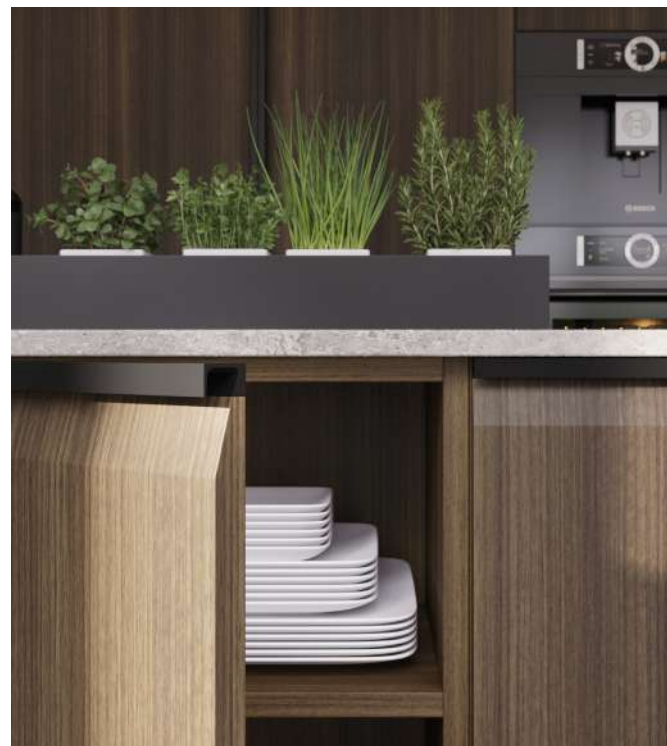
Tirador SUA + Puerta en MADERA

Todas las zonas del hogar, a pesar de ser diferentes, mantienen una conexión. Y esta continuidad visual aporta belleza a un hogar en el que existe una comunicación constante entre el todo y las partes.